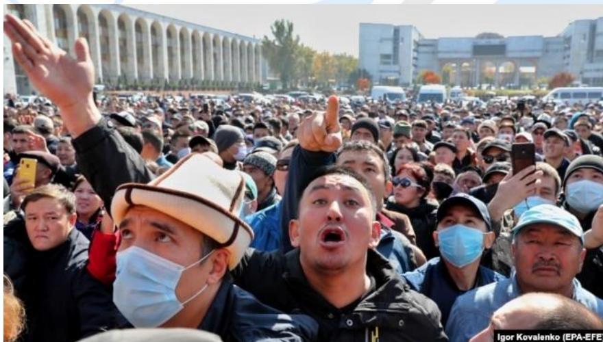
تجمع در میدان مرکزی بیسک، ۱۷ اکتبر ۲۰۲۰