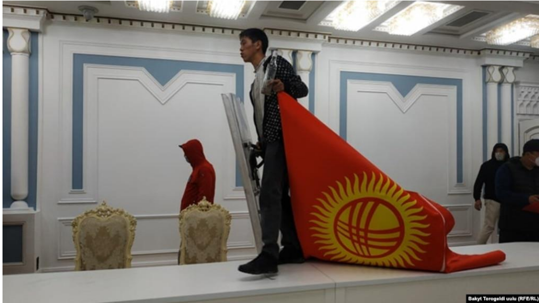
یک معترض در ساختمان پارلمان، ۶ اکتبر ۲۰۲۰