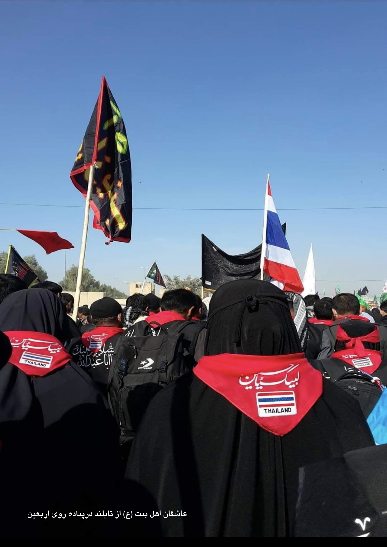
عاشقان اهل بیت (ع) از تایلند در پیاده روی اربعین