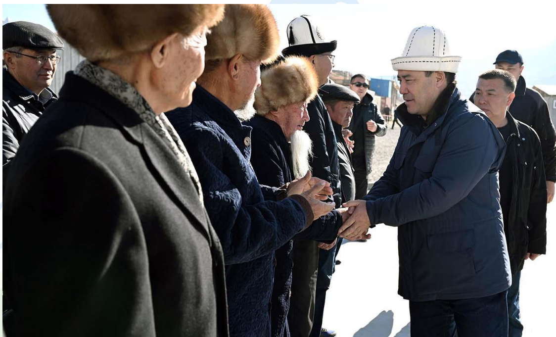
دیدار رئیس‌جمهور با ریش‌سفیدان یکی از روستاهای استان نارین

پس از اتمام بخش اصلی قورولتای، در سالن ورودی فیلامونی دولتی قرقیزستان، جایی که قورولتای برگزار شد، ارگان‌های دولتی «گوشه‌هایی» را برای حل سریع مسائل ترتیب دادند و وزرا نمایندگان را پذیرفتند و به سوالات آنها پاسخ دادند.