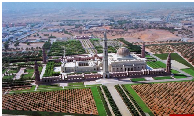
اباضیه و سایر مذاهب اسلامی

به لحاظ فرقه‌ای، فرقه نویسان اسلامی، اباضیه را از فرقه‌های خوارج می‌دانند. چند فرقه اصلی خوارج مانند ازارقه، نجدیه و صفریه می‌باشند؛ که اباضیه هم یکی از آن فرق است. اما منابع اباضی و خود اندیشمندان و محققان و طرفداران اباضیه معتقدند که به هیچ وجه اباضیه از خوارج نیست، مثلاً اگر در عمان یا شمال آفریقا یک اباضی را پیدا کنید و به او بگویید که شما از بازماندگان خوارج هستید، خیلی ناراحت می‌شوند و حتی تا مرز مذمت و سرزنش هم پیش می‌روند. لذا می‌گویند خوارج در حقیقت ازارقه هستند و نه اباضیه.