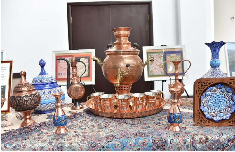
Press-service of Al-Farabi Kazakh National University

https://farabi.university/news/83049?lang=en