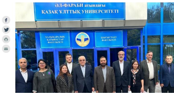
Әл-Фараби атындағы Қазақ ұлттық университеті

Қазақстан Палестинаға бір миллион доллар гуманитарлық көмек беледі