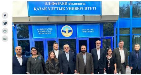
Әл-Фараби атындағы Қазақ ұлттық университеті