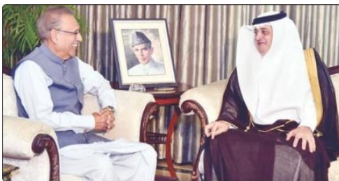
اسلام آباد، صدر عارف علوی سے سعودی سفیر نواف بن سعید المالکی ملاقات کر رہے ہیں

نواف بن سعید احمد المالکی، سفیر عربستان در اسلام آباد روز سه شنبه با دکتر عارف علوی، رئیس جمهور پاکستان در کاخ ریاست جمهوری دیدار کرد.