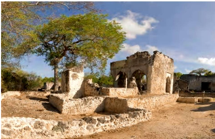
عمارت حاکم شیرازی - سونگومنارا (تصویر شماره ۴)

ساختمان بزرگی متعلق به یکی از ثروتمندان و یا خانواده‌ای از بزرگان شیرازی بوده است . بقایای عمارتی مرتفع شبیه برج نیز در این جزیره وجود دارد که مطمئناً برجی بلند بوده است . نام منارا که همان مناره است نیز بنظر می رسد از همین بنای برج مانند گرفته شده است .