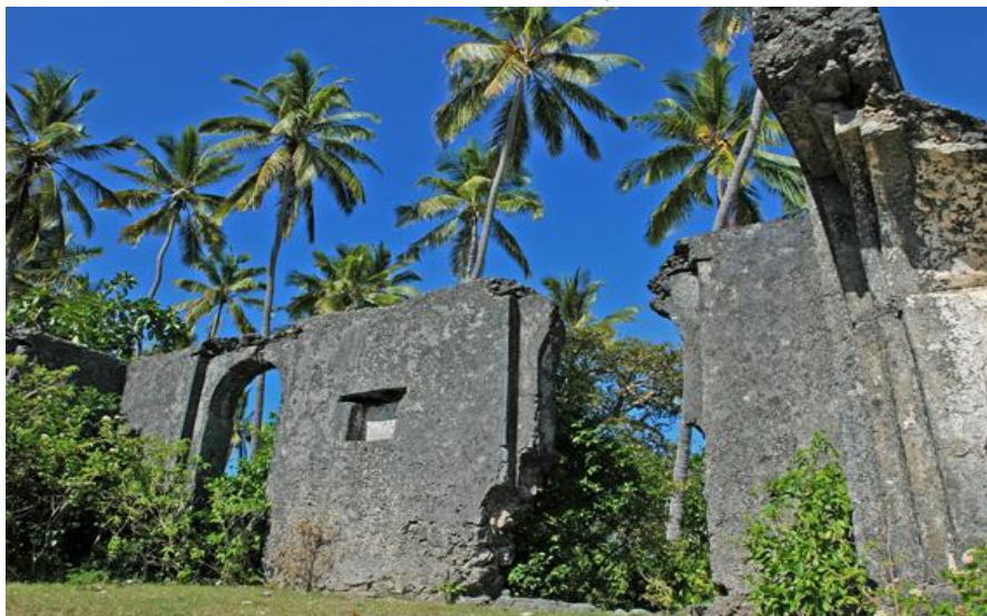
بقایای عمارت شیرازی در مافیا (تصویر شماره ۱۰)

شیرازی ها وجود دارد. در طی کشفیات باستان شناسی در جزیره "ژوانی" یکی از دو جزیره مهم متعلق به جزیره مافیا که در دهه ۱۹۵۰ میلادی صورت گرفته است نیز سکه هایی مربوط به قرن سیزدهم تا پانزدهم میلادی کشف شده که متعلق به سلاطین شیرازی حاکم بر این شهر بوده است. بر اساس سبک معماری بناهای موجود بنظر می رسد شهرهای "کوا" و "ژوانی" در جزیره مافیا توسط شیرازی ها احداث شده اند. ویرانه هایی در منطقه ای موسوم به "راس کیسیمانی" و مسجدی متعلق به قرن سیزدهم میلادی از دیگر آثار باستانی شیرازی ها در جزیره مافیا محسوب میشود. (مطالعات میدانی، دارالسلام، ۱۳۹۳)