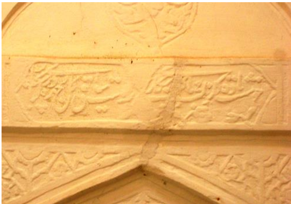
شعر فارسی گچ کاری شده بر سر در ورودی حمام (تصویر شماره ۱۳)

(۱۸۵۶-۱۸۰۴) برای همسر ایرانی خود شهرزاد که نوه دختری "فتحعلی شاه" بوده احداث گردیده است. (مشاهدات عینی نویسنده، زنگبار، حمام کیدیچی) حمام کیدیچی در مجموع حمام کوچکی است و با توجه به اینکه صرفاً مورد استفاده خانواده سلطنتی قرار می گرفته حمامی خصوصی محسوب می شده است. مصالح ساختمانی حمام کیدیچی نظیر حمام های دوره قاجاریه عمدتاً شامل سنگ مرمر، آجر، سنگ لاشه، تنبوشه، ملاط مستحکم گچ، آهک و ساروج است که با دقت توأم با ظرافت و استحکام در سقف، دیوارها و کف بنا به کار رفته اند. یکی از جالب ترین شاخصه های این حمام کتیبه نصب شده در سردر ورودی سالن اصلی حمام است که شعری از یکی از شعرای ایرانی به زبان فارسی بر آن کنده کاری شده است که البته در اثر گذشت زمان و مرمت ناشیانه این کتیبه به سختی قابل خواندن است: خوشست باده گلرنگ با کباب شکاری ز دست ساقی گل چهره در کنار بنخاری