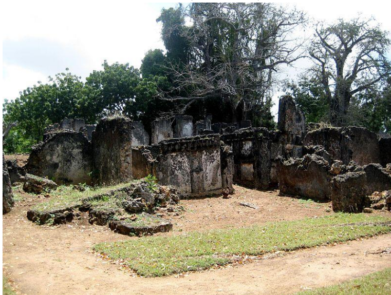
خرابه های عمارتی شیرازی در تونگونی (تصویر شماره ۹)

ای نیمه ویرانه در تونگونی کاشی شیشه ای یافت شده است که کلماتی فارسی بدین مضمون «شید - روشن» بر روی آن نقش گردیده است. (Burton: 61) این کلمات همان خورشید روشن است که از معدود کتیبه های فارسی در شرق آفریقا محسوب می شود. پرفسور فریمن گرینویل این کتیبه را که اکنون مفقود شده است یکی از دلایل مسلم حاکمیت شیرازی ها بر این منطقه دانسته است. (Greenville: 116) علاوه بر شهر "تونگونی" جزیره کوچکی در روبروی ساحل شهر تانگا در خلیج تانگا نیز موسوم به "جزیره شیرازی" است. در این جزیره خرابه های شهری قدیمی و مسجدی دربرگیرنده آثاری از معماری ایران بچشم می خورد که نمایانگر حضور شیرازی ها در این مکان طی قرون یازدهم تا چهاردهم میلادی است. (Prins: 36-8)