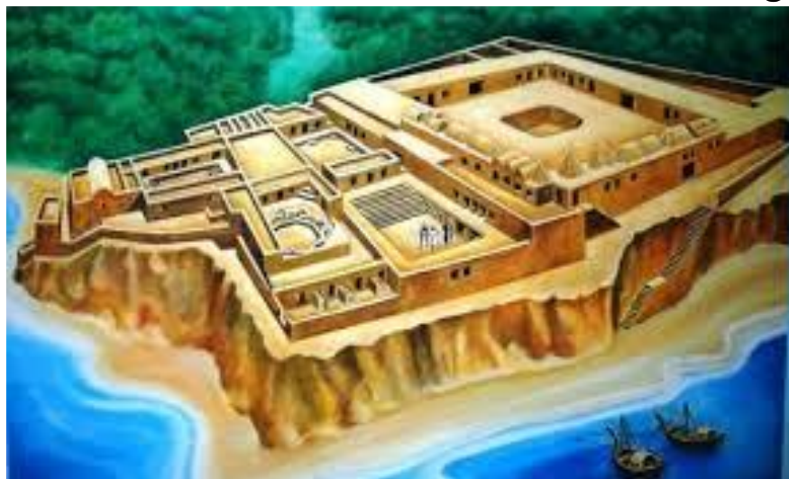
مدل بازسازی شده مجموعه عظیم تاریخی حصنی کوبوا (تصویر شماره ۵)

قصر حصنی کوبوا دربرگیرنده دو صحن اصلی بزرگ است که به اطاق‌های متعدد ختم می‌شود و در اضلاع شرقی و غربی نیز به ساختمان‌های فرعی منتهی می‌گردد. قسمت جنوبی این مجموعه نیز که به فعالیت‌های بازرگانی اختصاص داشته دارای صحنی است که بوسیله مجموعه‌ای از اطاق‌ها که مشخصاً به عنوان انبار استفاده می‌شده‌اند محاصره شده است. اطاق‌های واقع در شمال ورودی غربی و غرب ورودی شمالی دارای طبقات فوقانی می‌باشند. در ضلع جنوب غربی صحن نیز ساختمانی مجزا وجود دارد که قسمتی از آن زمانی دو طبقه بوده و تصور می‌شود به عنوان اطاق‌های مسئولان بخش‌های تجاری مورد استفاده قرار می‌گرفته است. نام کاخ حصنی کوبوا از "حصن" که معمولاً برای عمارات توأم با برج و بارو صورت می‌گرفته و "کوبوا" که در زبان سواحیلی به معنای بزرگ است اخذ گردیده است لذا معنای این کاخ «قصر بزرگ» یا «قصر باشکوه» می‌باشد که ترکیبی از دو کلمه عربی و سواحیلی است. (Sutton:24) مجموعه حصنی کوبوا در قرن چهاردهم میلادی و در زمان "سلطان الحسن بن سلیمان" از پادشاهان بزرگ سلسله شیرازی کیلوا احداث شده است. در بررسی این عمارت با شکوه مشخص می‌گردد که احداث این مجموعه در مدت زمانی کوتاه به پایان رسیده و شواهد قابل ملاحظه‌ای نیز وجود دارد مبنی بر اینکه احداث آن هیچ‌گاه بطور کامل پایان نیافته است. (Garlake: 70-71)