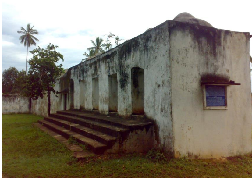
نمای غربی حمام کیدیچی (تصویر شماره ۱۲)

در سفر از زنگبار به کیدیچی و زدودن گرد و خاکی که بر آنها می نشست موثر بوده است. (Chris & Susan mcintyre, 2013: 211) علاوه بر آن گفته شده است که "سلطان سعید بن سلطان" به این منطقه که حدود ۱۲۰ متر از سطح دریا ارتفاع داشته علاقمند بوده و برای دیدن چشم‌انداز زیبای منطقه و منظره غروب خورشید بطور مرتب به کیدیچی سفر می کرده و در نهایت با خواهش زن ایرانی اش تصمیم به ساخت حمامی به سبک ایرانی می گیرد. (گفتگو با عبدالله خمیسی، زنگبار، ۱۳۹۴)