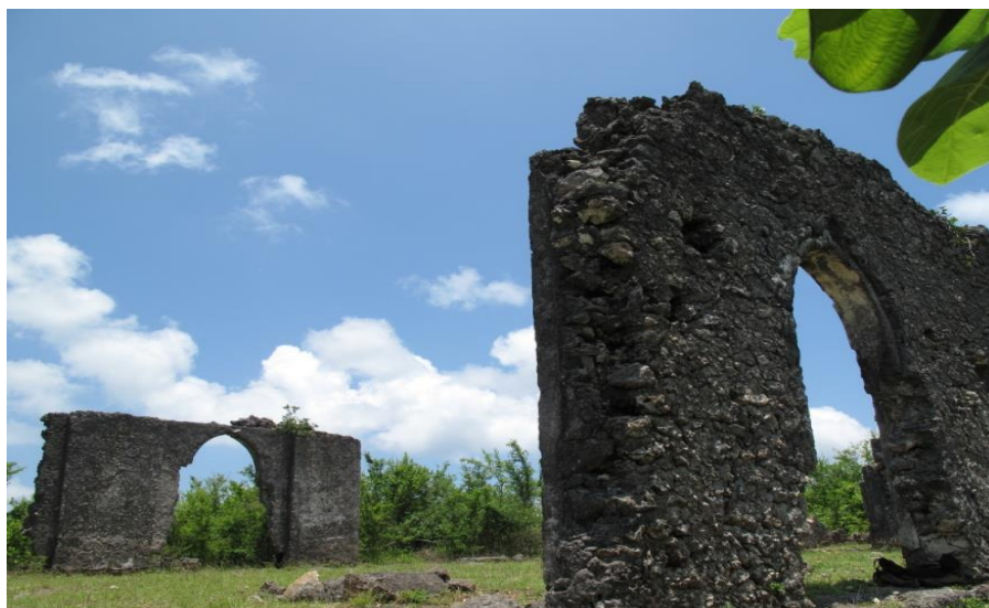
بقایای نمونه ای از عمارت‌های شیرازی در تومباتو (تصویر شماره ۱۴)

شیرازی‌ها مسجد نیمه ویرانه تومباتو از لحاظ هنری در زمره بهترین بناهای تاریخی دوره حاکمیت ایرانیان در سواحل شرق آفریقا می باشد. این مسجد دارای بالکن منحصر بفردی برای زنان بوده است و از این بابت در بین سایر آثار باستانی شرق آفریقا شاخص محسوب می شود. فرانسویس پیرس حکمران انگلیسی زنگبار (۱۹۲۲-۱۹۱۴ م) معتقد است این مسجد بر اساس الگوی مسجد زینب در قاهره یا مسجدالاقصی اورشلیم ساخته شده است و آن را بهترین نمونه معماری شیرازی‌ها در شرق آفریقا دانسته است. (khatib,31) جزیره تومباتو تا کنون مورد بررسی باستان شناسان قرار نگرفته است لذا جدای از ویرانه‌های مورد اشاره هنوز آثار باستانی دیگری از شیرازی‌ها یافت نشده است با این حال کشف ظروف متعلق به قرن دوازدهم میلادی در این جزیره نمایانگر این امر است که در صورت انجام مطالعات باستان‌شناسی دقیق آثار فراوانی از دوره حاکمیت شیرازی‌ها کشف می شوند.