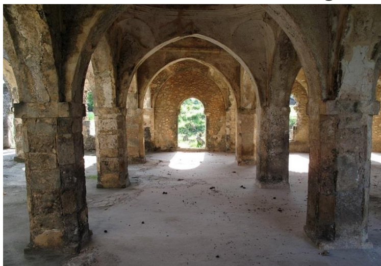
مسجد جامع کیلوا- ستون های سنگی چندضلعی و طاق های قوسی شبستان بزرگ (تصویر شماره ۱)

مسجد جامع کیلوا که از آن با عنوان "مسجد جمعه" و "مسجد بزرگ کیلوا" نیز یاد شده و وقایع نامه کیلوا هم به آن اشاره کرده است یکی از مهم ترین آثار باستانی شیرازی ها در شرق آفریقا است که در اواسط قرن یازده میلادی تاسیس شده است .