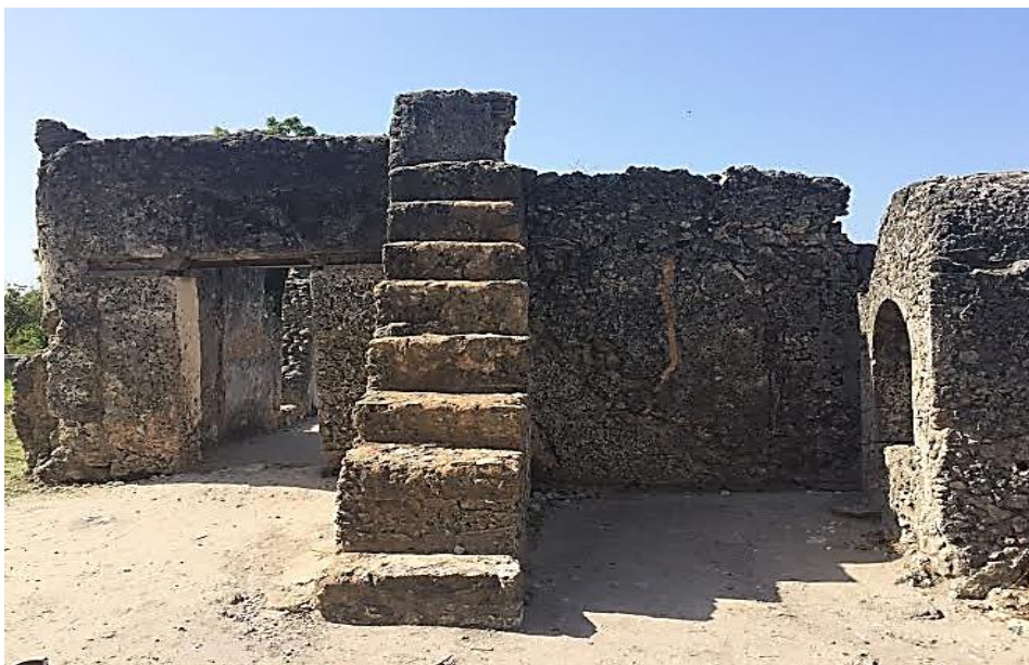
امویو - پله‌های سنگی مسجد کائوله (تصویر شماره ۸)

واز آن زمان تاکنون گروهی از بلوچ‌های ایرانی الاصل در این شهر زندگی و ادعا می‌کنند از نسل سربازان ایرانی بلوچ می‌باشند که در خدمت عمانی‌ها بوده‌اند. شهرکائوله در قرن نوزدهم بدلیل بارندگی‌های زیاد و ایجاد باطلاق‌هایی در اطراف آن به شهری متروکه مبدل گشت. (Chittick, ۳۴). امروز خرابه‌های این شهر از آثار باستانی مهم کشور تانزانیا محسوب می‌شود و برخی گردشگران غربی از طریق باگامویو به این مکان سفر و با گوشه‌هایی از فرهنگ و تمدن ایرانیان از نزدیک آشنا می‌شوند.