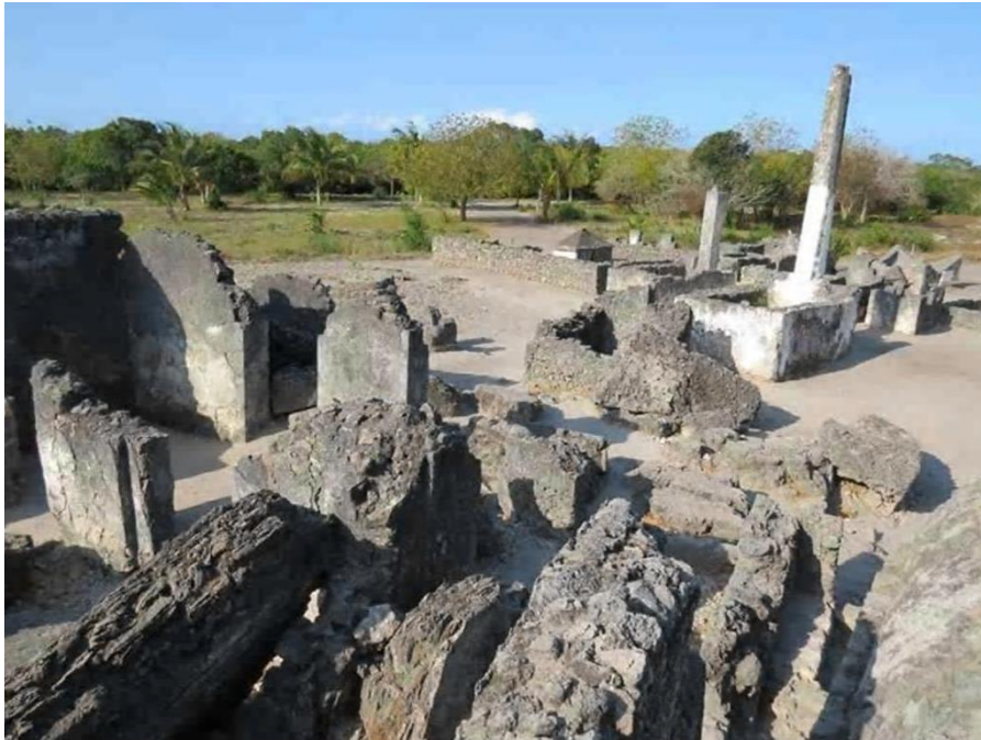
نمای شرقی شهر تاریخی کائوله (تصویر شماره ۷)

در مجاورت این مقبره‌ها نیز بقایای عمارت بزرگی وجود دارد که در طی عملیات باستان‌شناسی، ظروف چینی متعدد مزین به نقش و نگارهایی به زبان عربی متعلق به قرن پانزدهم از این مکان بدست آمده‌اند. این عمارت ظاهراً تا اواخر قرن پانزدهم مورد استفاده قرار می‌گرفته و احتمالاً مقر حکومت حاکم شیرازی کائوله بوده است. تکه‌هایی از ظروف سفالی متعلق به قرن سیزدهم و چهاردهم در زیر سقف این عمارت بدست آمده که نشان می‌دهد این بنا در قرون ۱۳ و ۱۴ میلادی احداث شده است. علاوه بر آن بقایایی از دیوار سنگی در کائوله بچشم می‌خورد که نشان می‌دهد شهر کائوله دارای دیواری بوده است که شهر را از خطر حمله بومیان مصون می‌داشته است. احتمالاً این دیوارها دارای برج‌هایی برای نگهبانی نیز بوده‌اند که امروز اثری از آنها بچشم نمی‌خورد. (مشاهدات عینی: کائوله، ۱۳۹۳) شهر کائوله پس از حمله پرتغالی‌ها به حکومت‌های محلی شیرازی دچار رکود گردید و پس از متروک ماندن به مدت چند قرن، در اواسط قرن هجدهم میلادی و پس از ورود عمانی‌ها به شرق آفریقا مورد توجه آنها قرار گرفت به گونه‌ای که این شهر به عنوان مقر سپاهیان عمانی در نظر گرفته شد. عمانی‌ها پادگانی متشکل از سربازان ایرانی الاصل بلوچ را در این شهر مستقر ساختند