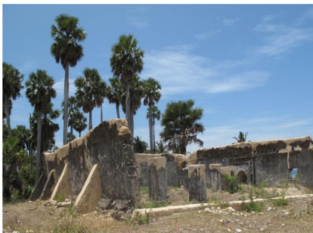
مسجد بزرگ شیرازی‌ها - حومه چاکه-چاکه جزیره پمبا (تصویر شماره ۱۵)

ویرانه‌ها در برگیرنده چندین عمارت سنگی، سه ستون، ده‌ها مقبره و یک مسجد بزرگ متعلق به قرن چهاردهم است. در "پوجینی" نیز بقایایی از قلعه‌ای متعلق به قرن ۱۴ میلادی، یک مسجد و چندین آرامگاه و سنگ قبر وجود دارد. (مطالعات میدانی، پمبا، ۱۳۸۸) در شهرهای مختلف پمبا و در حومه شهرهای اصلی پمبا شامل: "وته"، "امکوانی" و "ویتونگوجه" نیز ده‌ها مسجد قدیمی متعلق به دوره حکومت شیرازی‌ها وجود دارند که خرابه‌های فعلی این مساجد حکایت از عظمت آنها در زمان رونق پادشاهی شیرازی‌ها دارد (Ingrams, 1931: 137) بر اساس مطالعات میدانی جدای از این مساجد در شهرهای "چواکا" و "اندانگونی" نیز خرابه‌هایی از دو مسجد، قلعه، قصرها و عمارات متعلق به شیرازی‌ها وجود دارند. علاوه بر آن در "پوجینی" قلعه‌ای قدیمی وجود دارد که به دوره حاکمیت شیرازی‌ها نسبت داده شده است. در روستای "ماکونگوه" نیز ساختمان مخروطی سنگی بچشم می‌خورد که مربوط به دوره حاکمیت ایرانیان بر جزیره پمبا است. از میان آثار باستانی پمبا بناهای تاریخی موجود در "اندانگونی" و "امکومبو" قدیمی‌ترین ابنیه تاریخی بشمار می‌روند و قدمت آنها بین قرن‌های ده تا ۱۲ میلادی تخمین زده شده است. در این بناهای تاریخی علاوه بر عمارات مختلف سنگی چند آرامگاه ۱۳ ستونه به چشم می‌خورند که با وجود آن که تنها ۴ ستون این مقبره‌ها پابرجای مانده‌اند ولی نمایانگر عظمت آنها در دوره حاکمیت شیرازی‌ها است. (Gray, 1965: 54)