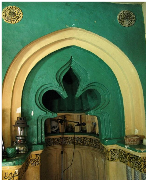
مسجد کبزمکازی - رسم الخط کتبه کوفی دورتا دور محراب (تصویر شماره ۱۱)

۲- حمام ایرانی کیدیچی : یکی از مهم ترین آثار تاریخی ایرانی در کشور تانزانیا حمام ایرانی موسوم به "کیدیچی" است . این حمام قدیمی که در قلب کشتزارهای زیبا و سرسبز میخک در منطقه "کیدیچی" در فاصله سه کیلومتری از جنگل "بوبوبو" در شمال شرق جزیره اصلی مجمع الجزایر زنگبار (جزیره اونگوجا) و در منطقه دوری از شهر زنگبار قرار دارد (Briggs:325)، از شهرت زیادی در زنگبار برخوردار بوده و در زمره مناطق مهم گردشگری جمهوری خودمختار زنگبار محسوب می شود. حمام ایرانی کیدیچی در سال ۱۸۵۰ میلادی بدستور "سلطان سعید بن سلطان" از سلاطین عمانی زنگبار و برای جلب رضایت خاطر همسر ایرانی اش احداث گردیده است. بر اساس مستندات موجود "سلطان سعید بن سلطان" که در سال ۱۸۴۷ میلادی با "شهرزاد بیگم" یکی از نوادگان "فتحعلی شاه" ازدواج کرده بود برای رضایت خاطر همسر زیبای خود دستور داد حمامی به سبک ایرانی در این جزیره احداث کنند . (۲۰۱۳:۲۶۲ Webber) جدای از آن سلطان سعید و شهرزاد معمولاً برای شکار یا نظارت بر کار کارگران مزارع میخک به کیدیچی سفر می کردند و این حمام برای رفع خستگی آنها