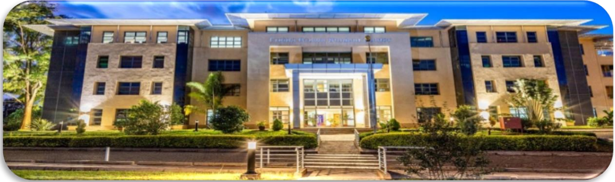
United States International University-Africa (USIU-Africa)

کلاس های زبان و فرهنگ چینی در سال 2015 با 300 دانش آموز به زبان چینی مبتدی یک (1)، 169 دانش آموز در زبان چینی مبتدی دو (2)، 8 دانش آموز در سطح متوسط و 11 دانش آموز در سطح پیشرفته آغاز شد. در آن سال 488 دانش آموز برای یادگیری زبان چینی ثبت نام کردند. پنج زبان خارجی دیگر قبلاً در دانشگاه تأسیس شده بود، بنابراین چین مجبور شد برای موقعیت خود با بقیه رقابت کند. از سال 2015 بیش از 3000 دانشجو برای یادگیری زبان چینی در USIU ثبت نام کرده اند. و در طول سال ها، زبان چینی فراگیر شد.