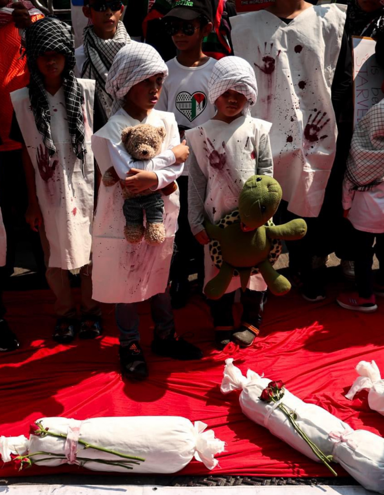
تجمع روز قدس در مقابل سفارت رژیم صهیونیستی در بانکوک