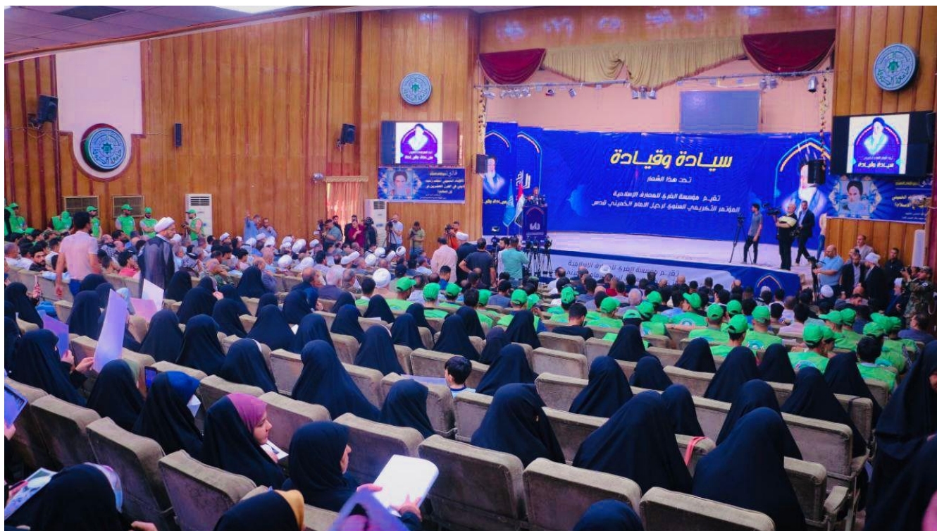
برگزاری مراسم سی و چهارمین سالگرد ارتحال حضرت امام خمینی(ره) در استان بصره