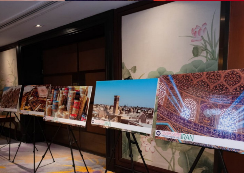
نمایشگاه رایزنی فرهنگی در جشن ۴۵مین سالگرد انقلاب شکوهمند اسلامی - بانکوک