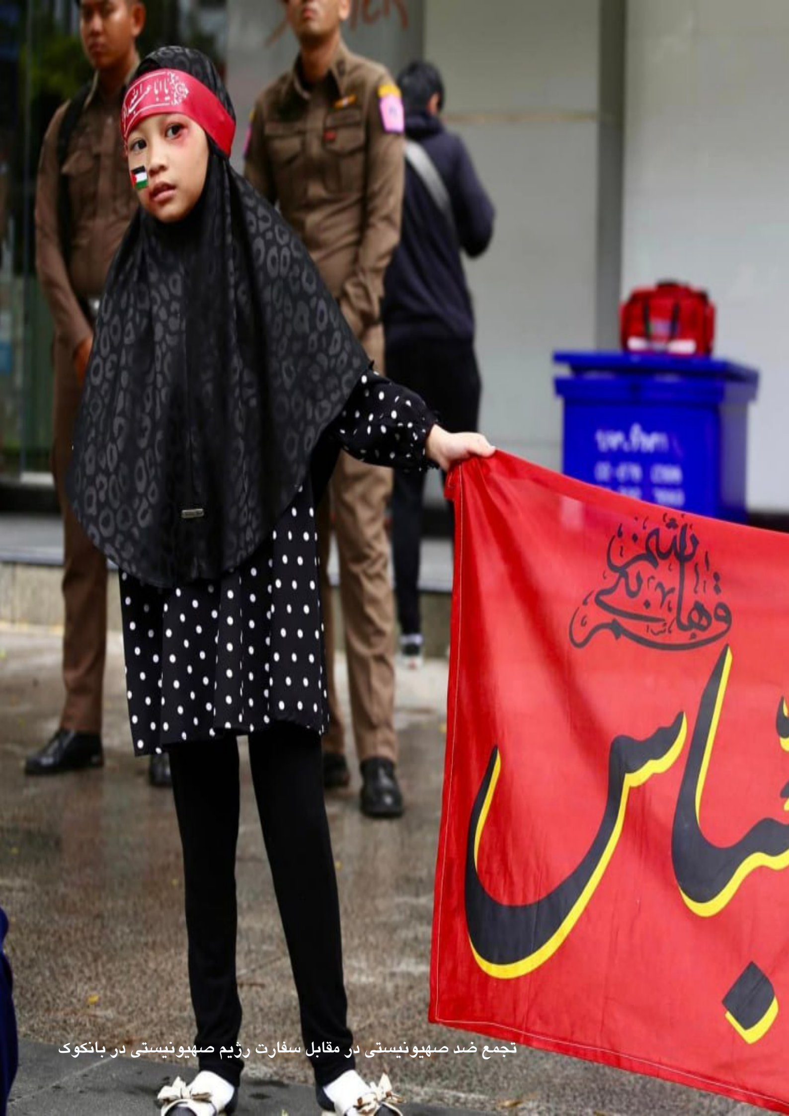
تجمع ضد صهیونیستی در مقابل سفارت رژیم صهیونیستی در بانکوک